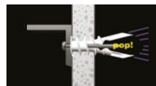
• Automatik - Verankerung