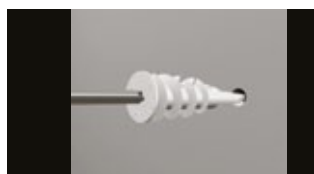
• Selbstbohrender Dübel