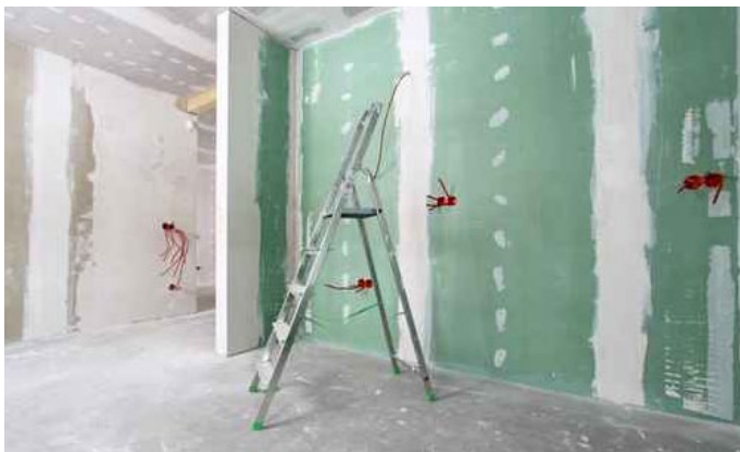
Verarbeitung bei Gipskartonplatten ohne Vorbohren

Die patentierten Gipskarton-Schraubdübel aus den USA wurden speziell für einfache Verarbeitung von Gipskartonplatten entwickelt. Nur TOGGLER - Gipskarton-Schraubdübel spreizen sich beim Eindrehen der Schraube in den Dübel hinter der Gipskartonplatte und rasten dort hörbar mit „Klickgeräusch“ ein. Diese einmalige Produkteingeschaft sichert die unerreicht hohen Haltekräfte unserer Gipskarton-Schraubdübel. Der amerikanische Hersteller wirbt treffend mit dem Slogan : „The Strongest Snap-Screw of the world“. Keine der vielen am Markt erhältlichen Kopien unserer Schraubdübel erreicht nur annähernd die Haltekräfte unseres Originals. Jeder TOGGLER- Gipskartondübel trägt den Eindruck „TOGGLER“ – nur mit dieser Marke kaufen Sie das Original und erreichen die hohen Haltekräfte - achten Sie beim Einkauf darauf!