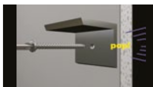
• Schraube eindrehen